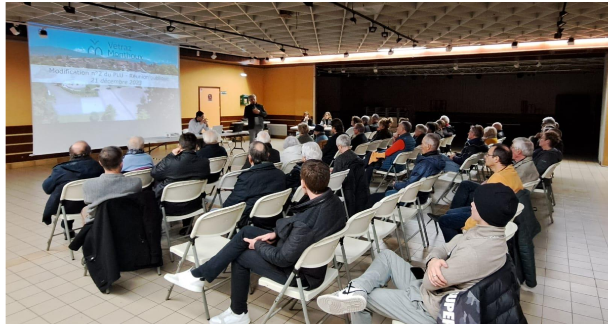
Réunion publique du 21 décembre 2023