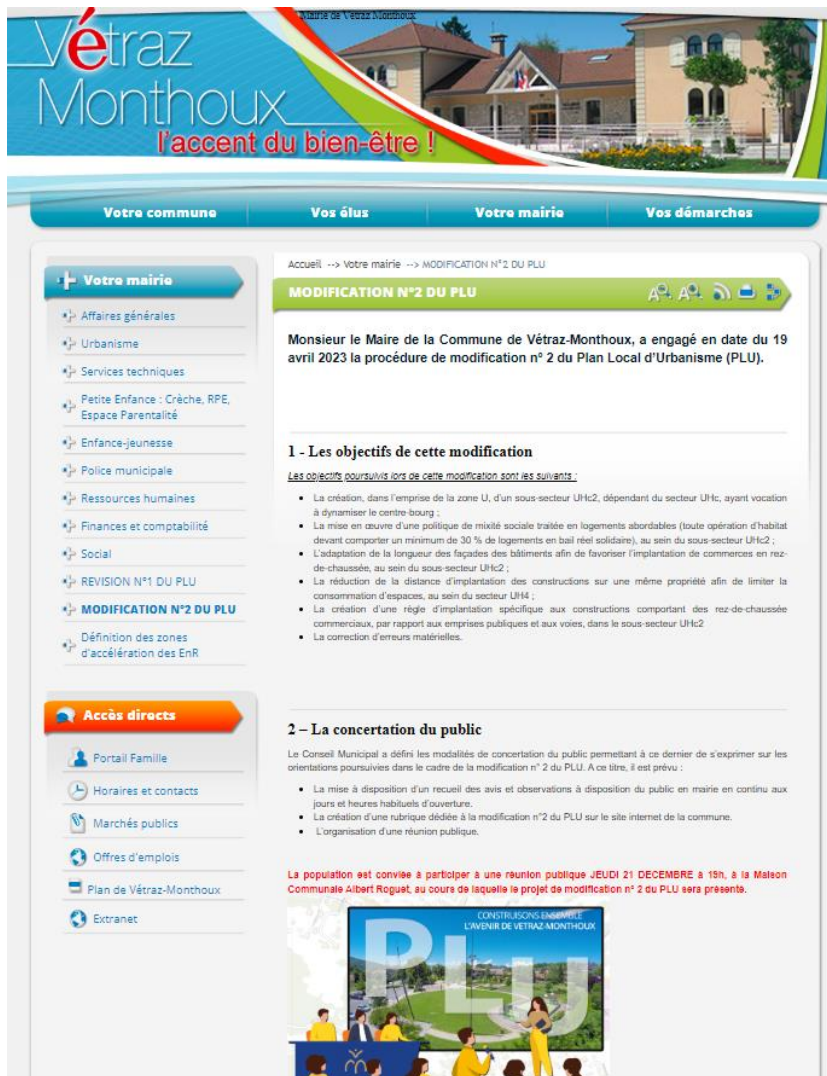
Figure 1 - Capture d'écran du site de la commune