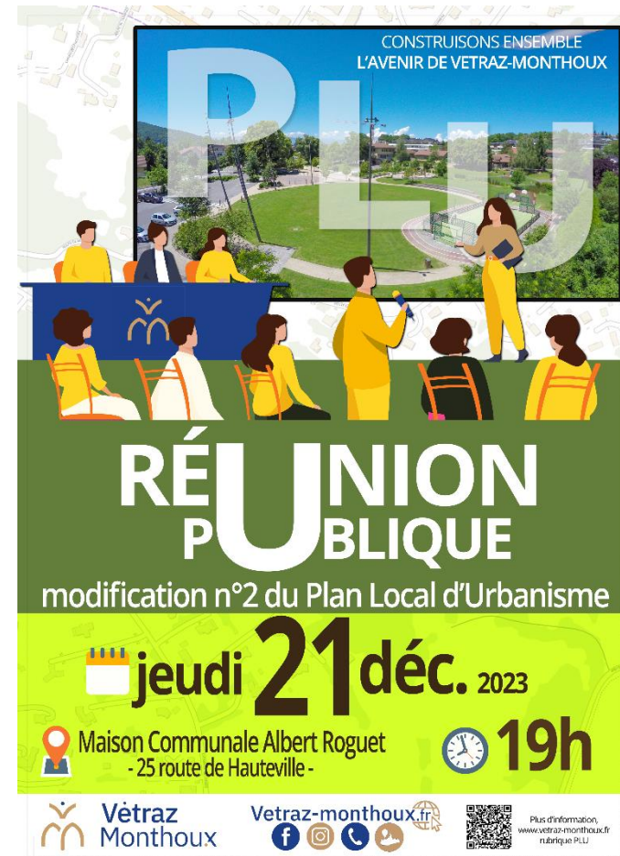
Figure 2 – Avis réunion publique

Une réunion publique a été organisée, présentant les objectifs de la modification et les outils réglementaires mis en place, le jeudi 21 décembre 2023 à la maison communale Albert Roguet. Cette séance a réuni une cinquantaine de personnes.