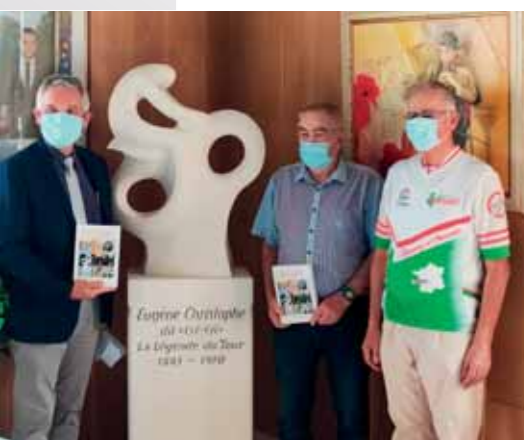
Stèle Eugène Christophe