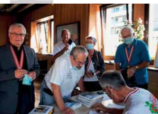
Séance de dédicace