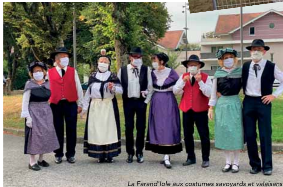
La Farand'iole aux costumes savoyards et valaisans