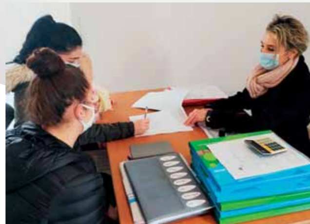
Signature du bail de location

15 appartements au sein de la résidence Bella Rossa , route des Ecoles, gérés par le bailleur social Haute-Savoie-Habitat.