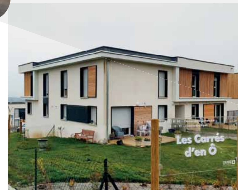
Résidence Les Carrés d'en Ô, chemin du Belvédère

Néanmoins, grâce à ses efforts (les objectifs fixés en accord avec la Préfecture sur la période 2017-2019 ont été atteints) et à la prise en compte de dépenses en faveur du logement social, le prélèvement sur les finances communales au titre de la loi SRU (solidarité et renouvellement urbain) a été ramené pour 2020 à 0€.